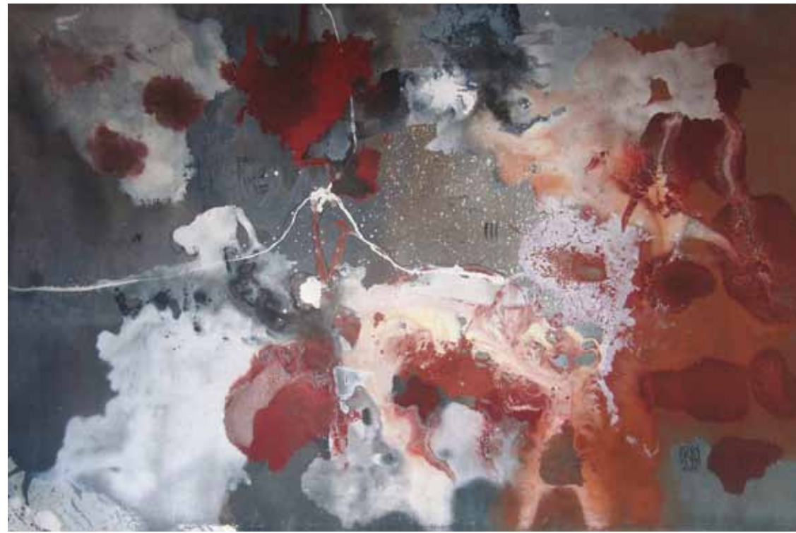
LA FINE 2011 — óleo sobre tela / oil on canvas 300 x 190 cm