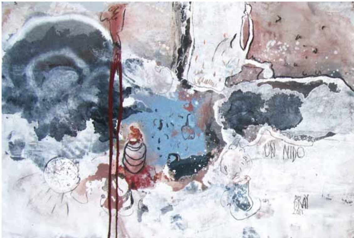
EL NIDO 2011 — óleo sobre tela / oil on canvas 70 x 100 cm