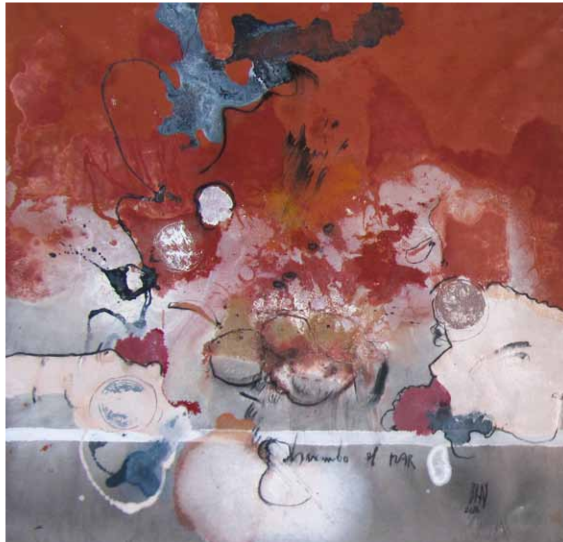
BUSCANDO EL MAR 2011 — óleo sobre tela / oil on canvas 100 x 100 cm