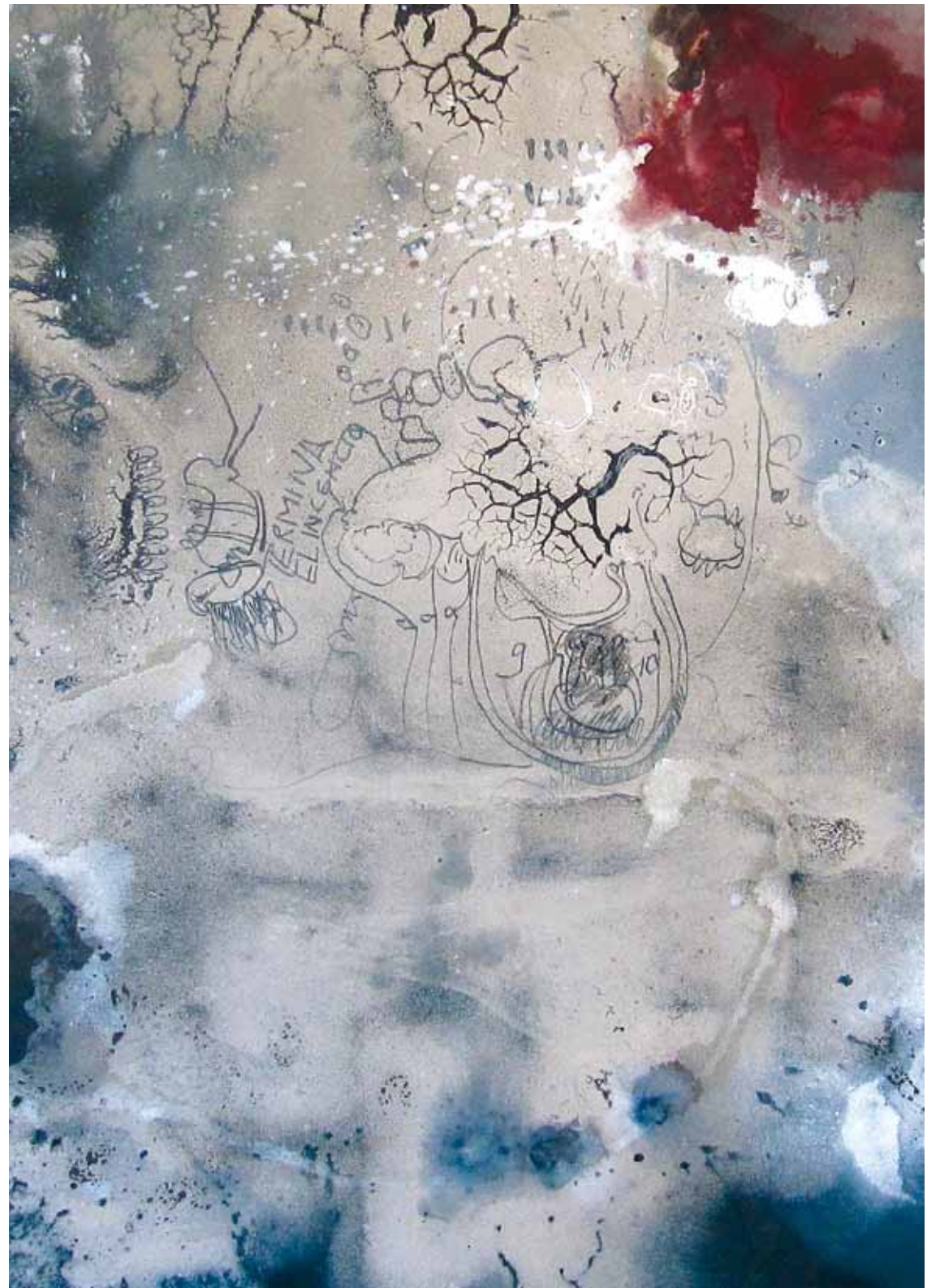
EL INCENDIO 2010

— óleo sobre tela / oil on canvas 220 x 200 cm