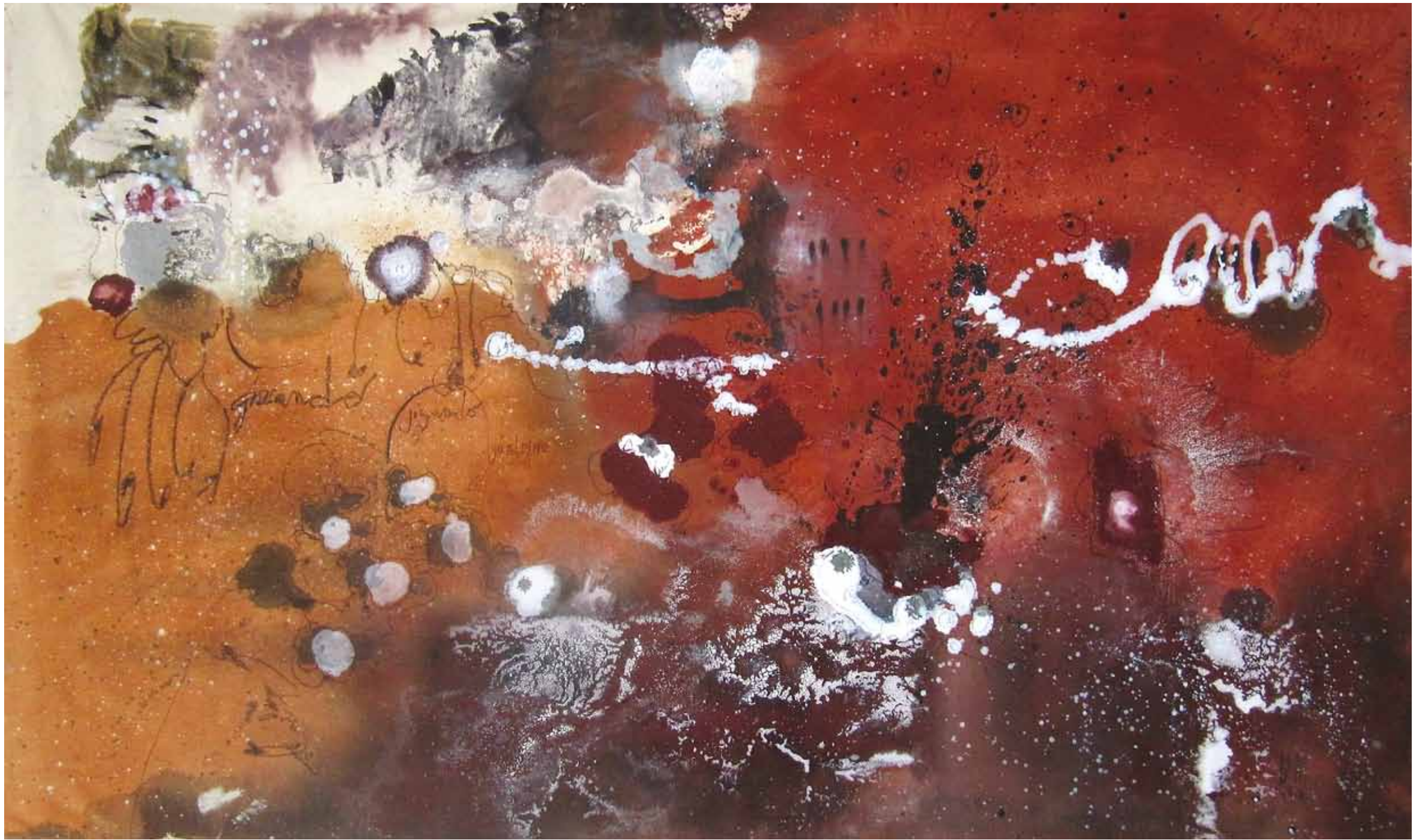
YO DELFINO 2010 — óleo sobre tela / oil on canvas 240 x 140 cm