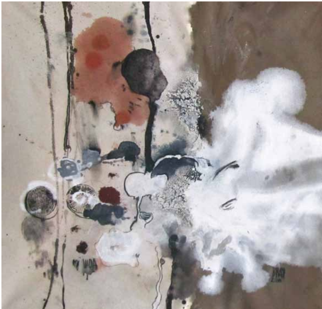
MI VDA 2011 — óleo sobre tela / oil on canvas 100x 100 cm