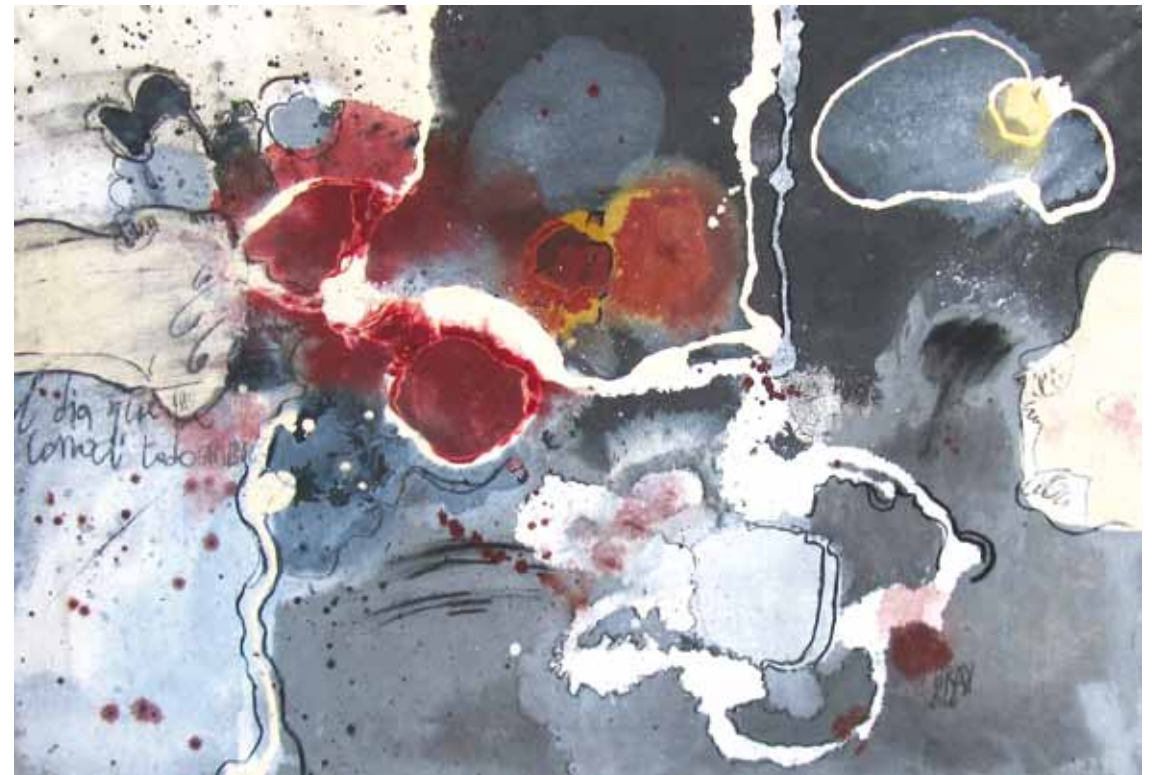
TODO CAMBIO 2011 — óleo sobre tela / oil on canvas 70 x 100 cm