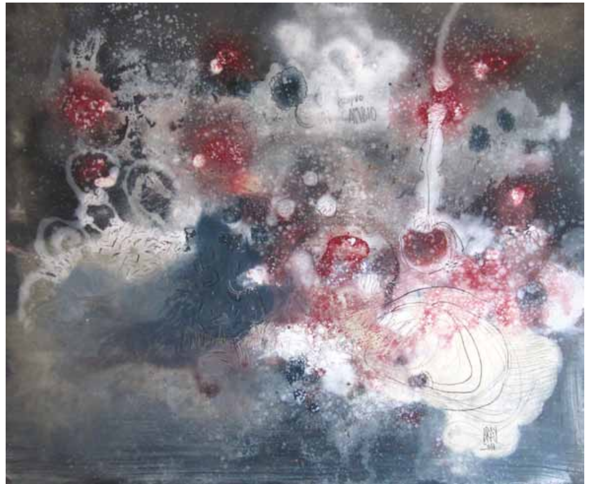
CAMBIO 2010 — óleo sobre tela / oil on canvas 236 x 200 cm