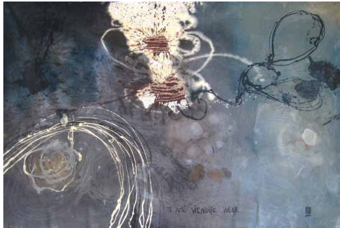
VOLANDO 2010 — óleo sobre tela / oil on canvas 280 x 180 cm