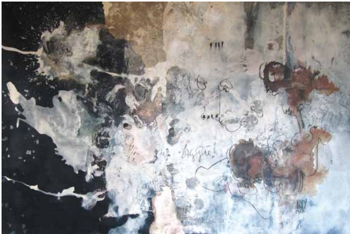
LAGGIU' 2010 — óleo sobre tela / oil on canvas 240 x 160 cm