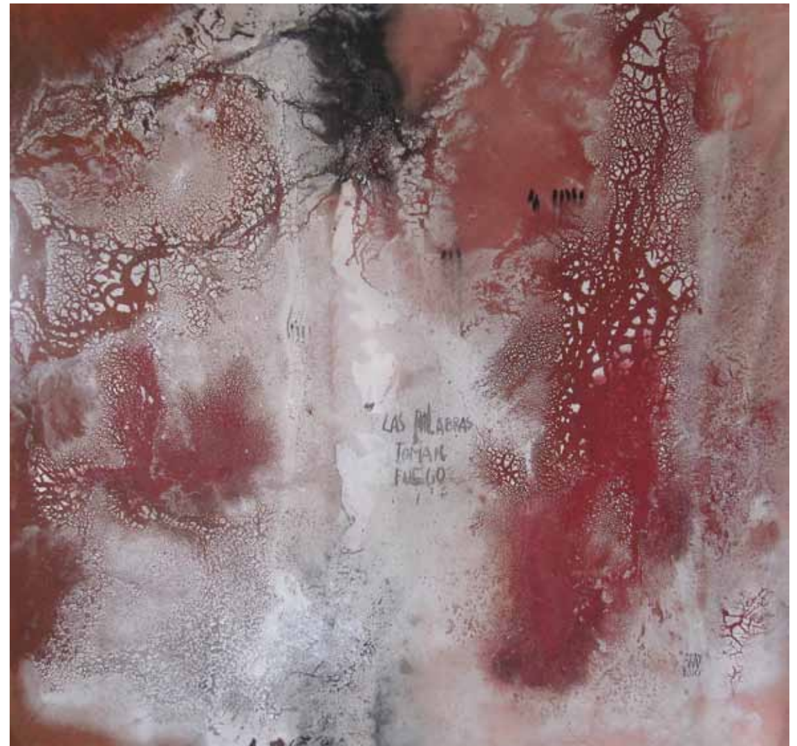
FUEGO 2011 — óleo sobre tela / oil on canvas 210 x 180 cm