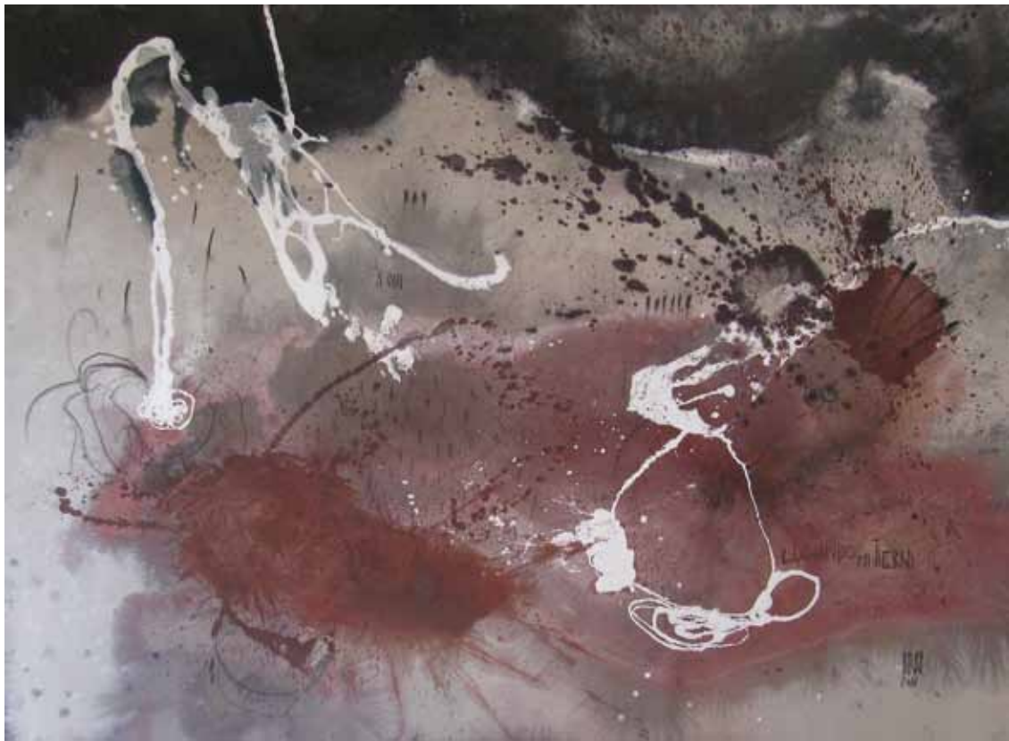
LUCHANDO 2011 — óleo sobre tela / oil on canvas 240 x 160 cm